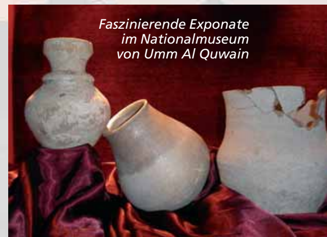
Faszinierende Exponate im Nationalmuseum von Umm Al Quwain