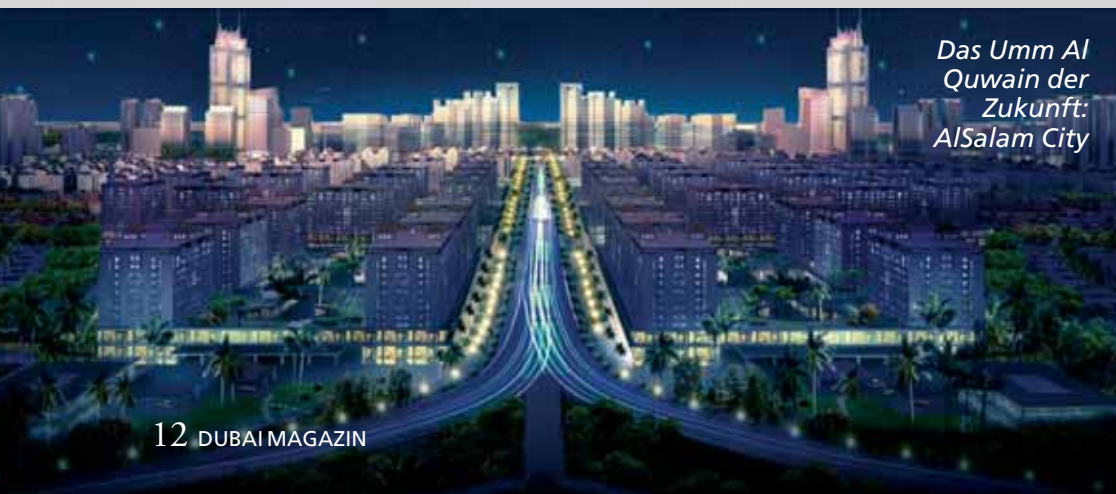
Das Umm Al Quwain der Zukunft: AlSalam City