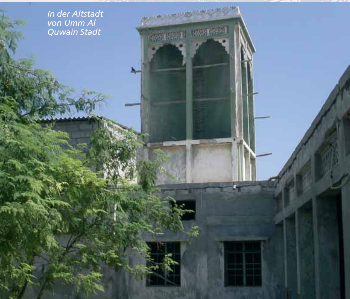
In der Altstadt von Umm Al Quwain Stadt