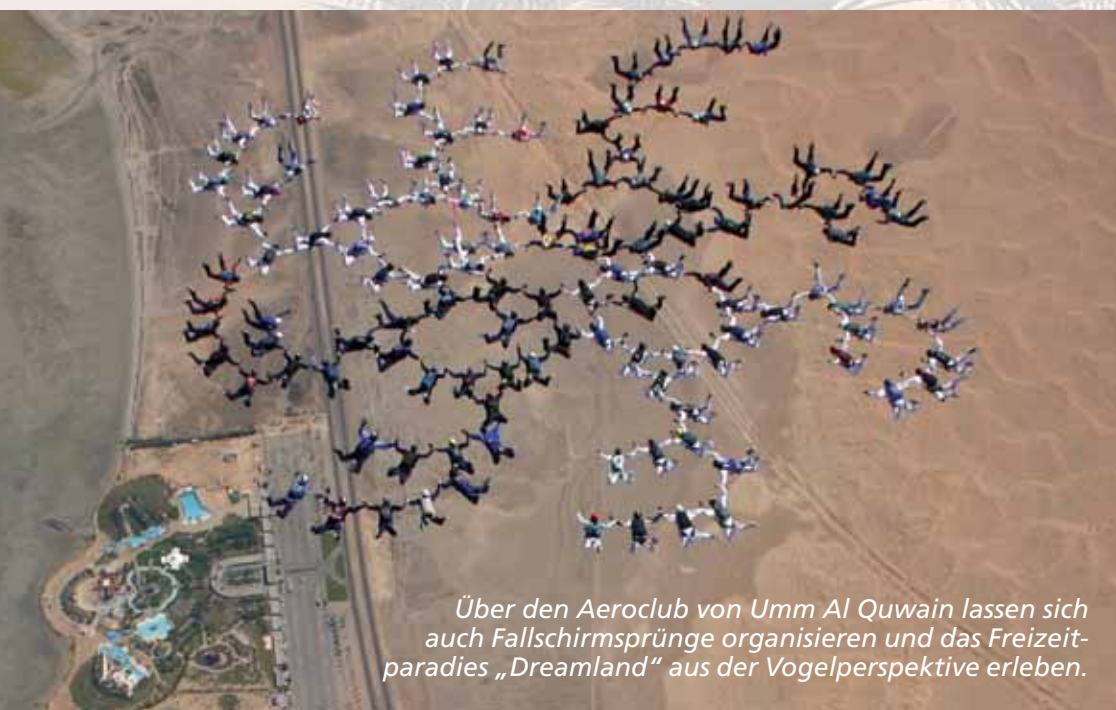
Über den Aeroclub von Umm Al Quwain lassen sich auch Fallschirmsprünge organisieren und das Freizeitparadies „Dreamland“ aus der Vogelperspektive erleben.