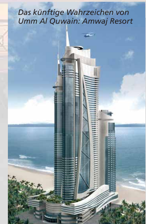
Das künftige Wahrzeichen von Umm Al Quwain: Amwaj Resort

Bereits in drei Jahren wird der Anblick von Umm Al Quwain Stadt ein anderer als bisher sein: Auf der unbewohnten Spitze der Halbinsel wird – als einziges Hochhaus der Hauptstadt und neues Wahrzeichen - bis 2010 das Amwaj Resort mit Privatstrand entstehen. Mit dem Bau wurde bereits begonnen. Die Anlage besteht aus 2 Türmen, die Wohnungen für Einheimische und Touristen, ein Hotel und Shopping Malls enthalten. Im Dana Tower kann das preiswerteste 2-Zimmer Appartement mit 1.281 sqft (ca. 120 qm) zu 640 AED pro sqft (ca. 1.370,- Euro pro qm) erworben werden. Im Morgan Tower ist der Preis für das preiswerteste 1-Zimmer Appartement mit 657 sqft