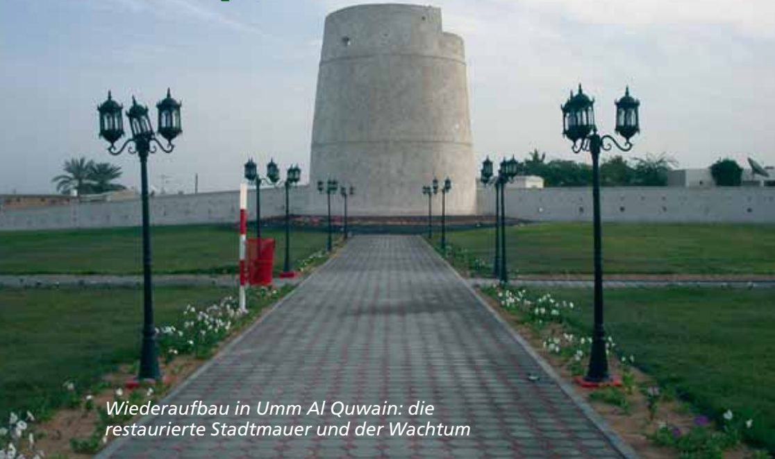
Wiederaufbau in Umm Al Quwain: die restaurierte Stadtmauer und der Wachturm