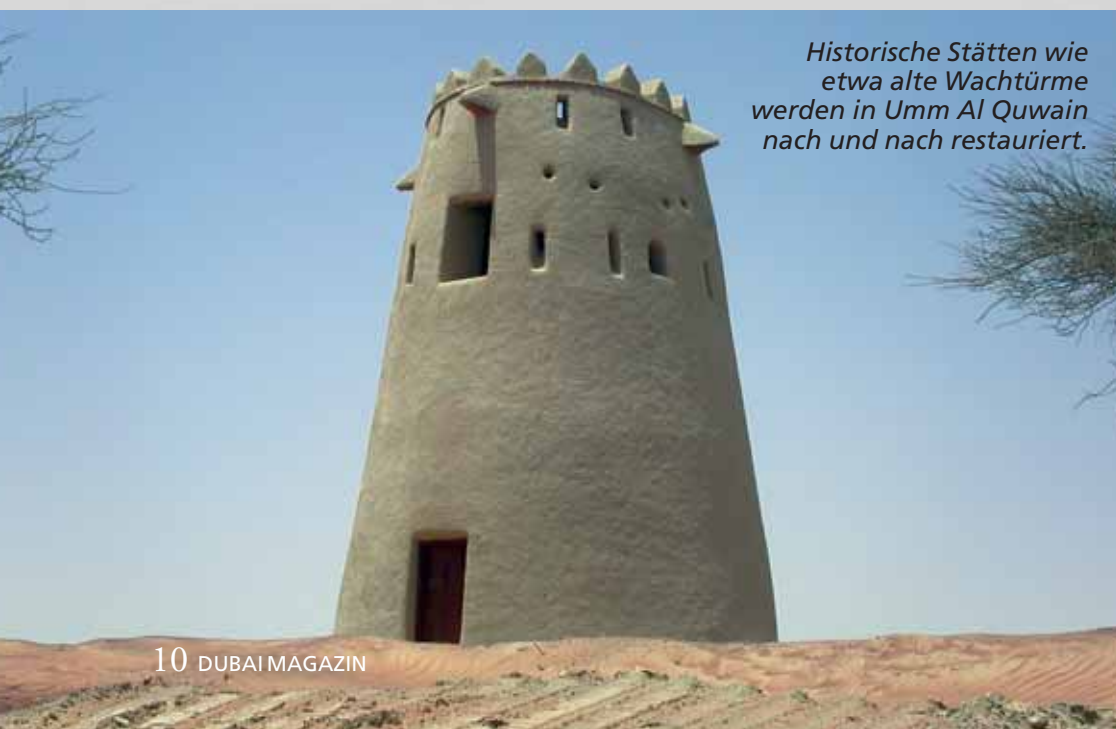
Historische Stätten wie etwa alte Wachtürme werden in Umm Al Quwain nach und nach restauriert.

R echnet man die Inseln der Emirate nicht mit, dann entspricht die Fläche von UAQ gerade mal 1 Prozent des Landes. Das Emirat besteht aus flacher Halbwüste mit salzigen Flächen in Küstennähe. UAQ hat etwa 66.000 EW und ist damit das bevölkerungsärmste Emirat. Früher verdienten die Menschen ihren Lebensunterhalt durch Perlentauchen, Landwirtschaft und Fischen. Viele Einwohner sind heute noch Fischer und im Fischereihafen scheint die Zeit stehen geblieben zu sein. UAQ gehört mit seinen zahlreichen, ergiebigen Fischgründen – vor allem für Grouper, orientalische Seezunge, Königsdorsch, Brasse und Steingarnelen – zu den wichtigen Fischexporteuren für den Mittleren Osten und Europa. Wie die anderen kleinen Emirate Fujairah, Ras Al Khaimah und Ajman, ist auch UAQ auf die Zuwendungen des reichsten und größten Emirats Abu Dhabi angewiesen. In zunehmendem Maße werden jedoch erfolgreich eigene wirtschaftliche Pläne entwickelt. Ein wichtige Rolle spielt in UAQ weiterhin die Pflege der Traditionen, wie z. B. die Falknerei, die Kamelrennen (auf der sehr attraktiven und rege genutzten Kamelrennbahn Al Labsa an der Straße nach Al Ain) und der Bau von Dhaus in der Dhauwerft.