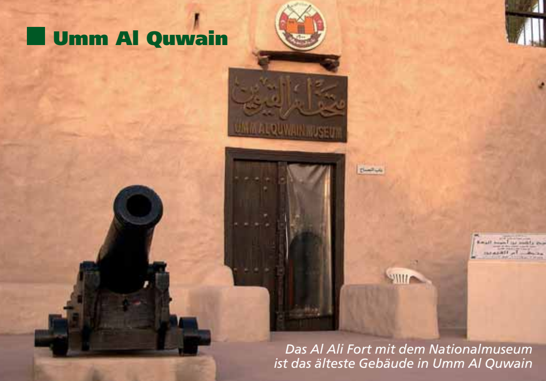
Das Al Ali Fort mit dem Nationalmuseum ist das älteste Gebäude in Umm Al Quwain