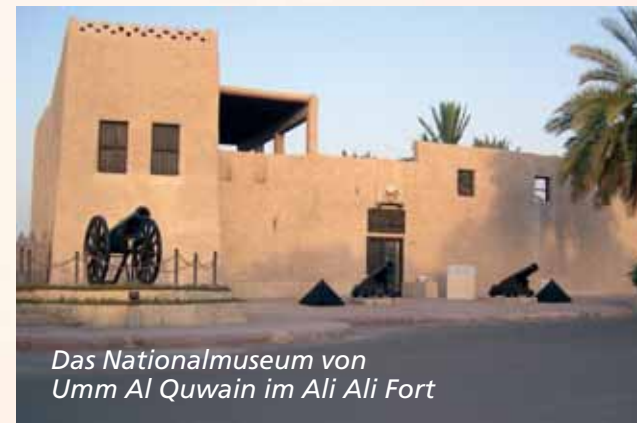
Das Nationalmuseum von Umm Al Quwain im Ali Ali Fort